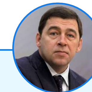
ЕВГЕНИЙ КУЙВАШЕВ Губернатор Свердловской области