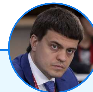
МИХАИЛ КОТЮКОВ Исполняющий обязанности губернатора Красноярского края