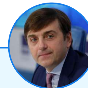
СЕРГЕЙ КРАВЦОВ Министр просвещения Российской Федерации